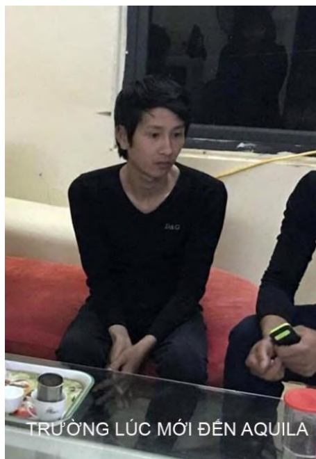
TRƯỜNG LÚC MỚI ĐẾN AQUILA

That changed one day when I met an old friend. In the past, he had injected drugs with a needle and joined me in my hustling activities.